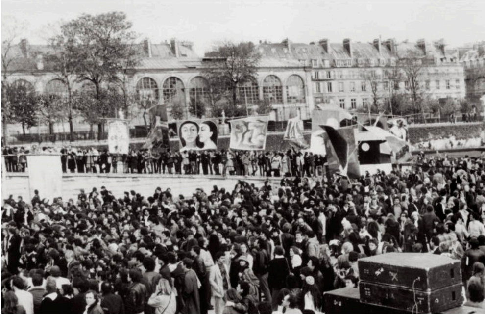
La marcha de la AIDA (Association Internationale de Défense des Artistes) , París, 14 de noviembre de 1981 Bajo la consigna "Cien pancartas en París por Cien artistas desaparecidos en Argentina", la AIDA recorrió los barrios de la capital francesa en repudio de las desapariciones, reclamando la liberación de los detenidos.

La Ciudad de Buenos Aires tiene el privilegio de contar con un espacio público que conjuga en perfecto equilibrio el arte con la memoria. La variedad de esculturas conmemorativas y el diseño del Monumento a las víctimas del Terrorismo de Estado nos invitan a la reflexión.